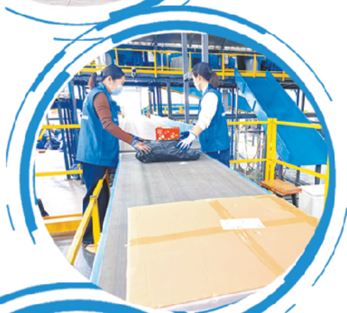
快递等待过扫描仪。