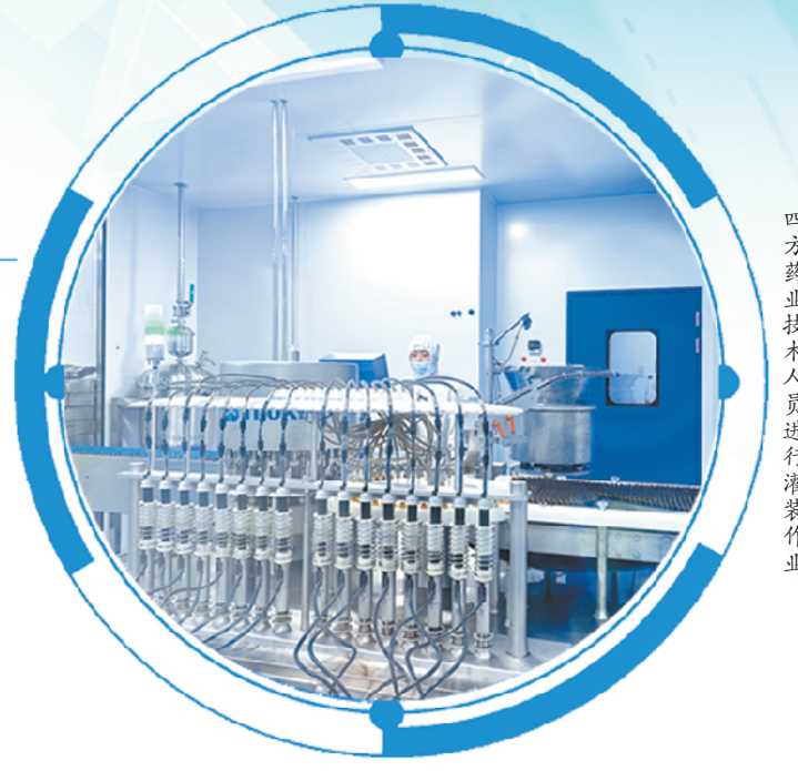
四方药业技术人员进行灌装作业。