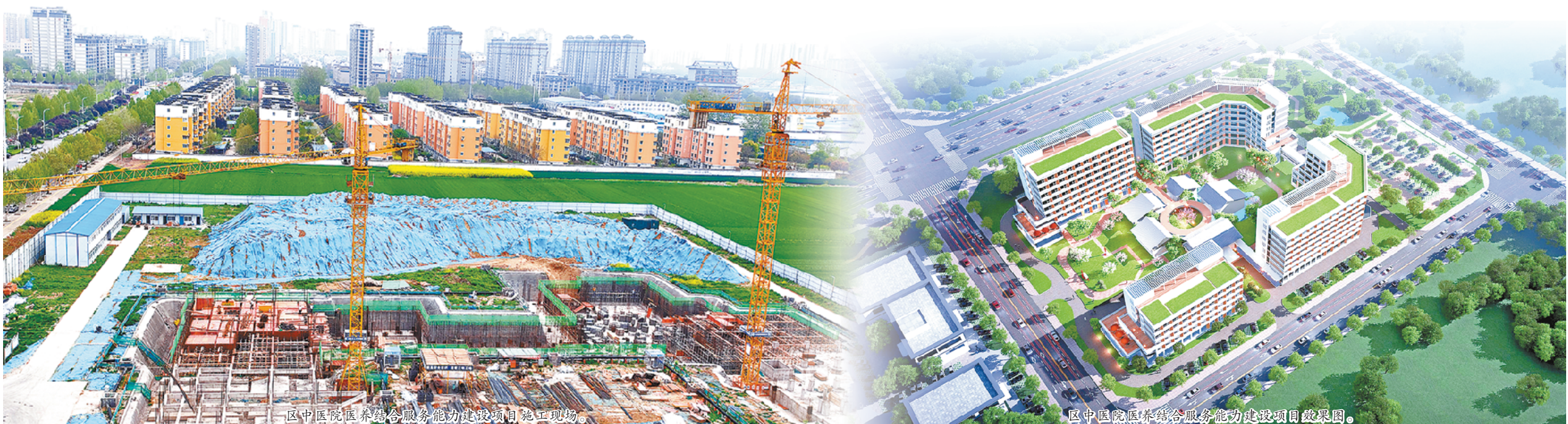
区中医院医养结合服务能力建设项目施工现场。