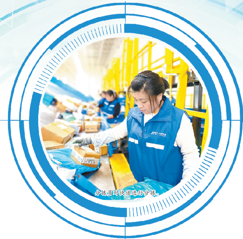
分拣员对快递进行分拣。

“四方药业的长期稳健发展,离不开川汇区全方位的支持。”该公司相关负责人表示,“政策、资源等方面的有力保障,极大增强了我们的发展信心。”