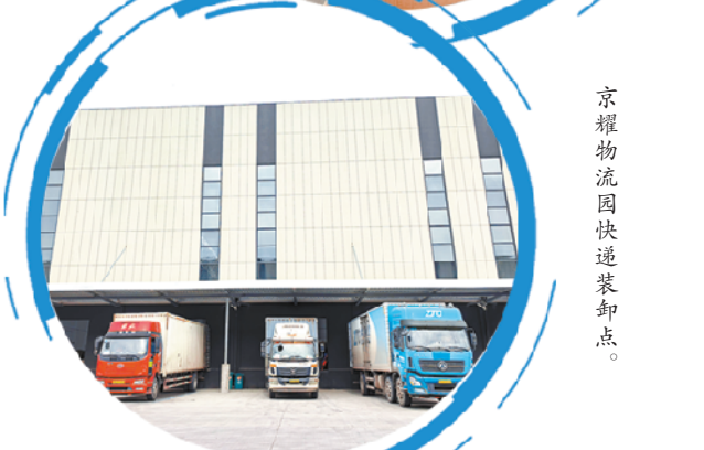
京耀物流园快递装卸点。