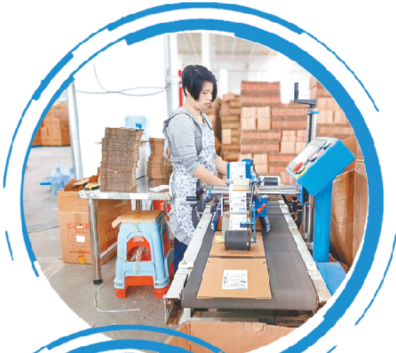
京耀物流园云仓工作人员进行贴单作业。

“为了让辖区居民早日享受到优质医疗资源,我们正加班加点施工,全力推进民生工程早日投用。”项目相关负责人说。