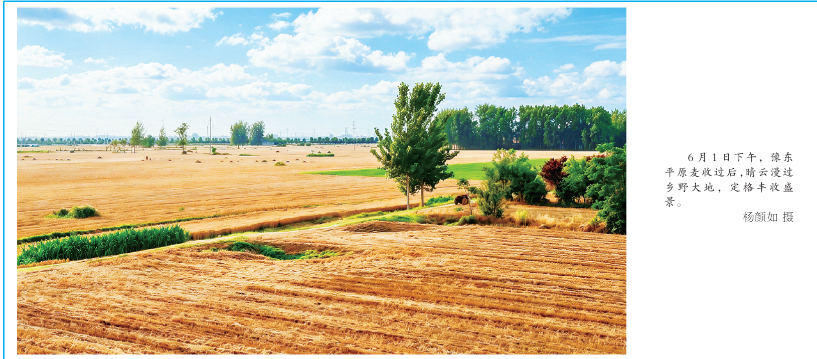
6月1日下午,豫东平原麦收过后,晴空漫过广袤大地,定格丰收盛景。