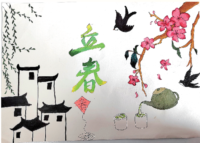
小记者:张宁茜 六(3)班 辅导老师:吴艳侠